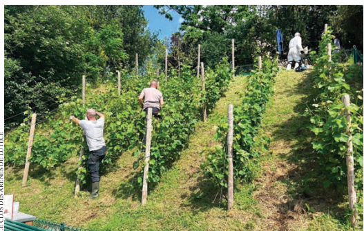
L'Igp Île-de-France conta oltre 450mila bottiglie prodotte nel 2025 e annovera ben 73 vitigni autorizzati, segno di grande sperimentazione

I presupposti del III millennio sono del tutto differenti. Lo sconvolgimento climatico martoria la viticoltura mediterranea, ma d'altro canto consente di ottenere maturità un tempo del tutto impensabili oltre il 47° o il 48° parallelo nord. Si assiste anche a una netta trasformazione della domanda, che ha preso le distanze da vini correnti per focalizzarsi su una produzione di pregio e un consumo occasionale. Questi presupposti si sposano con le tecniche produttive odierne, in grado di consegnare validi risultati anche molto a nord. Così, se solo vent'anni or sono fare vino a Parigi o nei dintorni era un'attività dilettantistica che faceva sorridere i più e i "vigneti" consistevano di qualche filare isolato, oggi le cose sono cambiate: un'offerta commerciale, superfici in crescita ogni anno, richieste di riconoscimenti ufficiali ormai del tutto doverosi, progetti di impianto sempre più consistenti, nascita ed espansione di diverse associazioni di categoria. Rilanciata nel 2016 dalla liberalizzazione dell'Ue a ripiantare vigna, l'avventura del Nord è oggi proiettata verso un futuro chiamato a superare una dimensione epica. Non si tornerà alle decine di migliaia di ettari vitati di inizio Ottocento, ma siamo di fronte a una svolta.