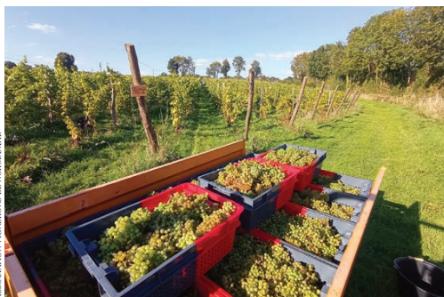
La Normandia spicca tra le regioni del nord transalpino, attirando l'interesse di alcuni viticoltori di Loira e Champagne